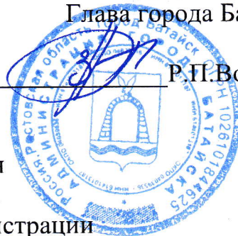
ГРАФИК личного приема граждан Главой города Батайска и заместителями главы Администрации ноябрь 2024 года