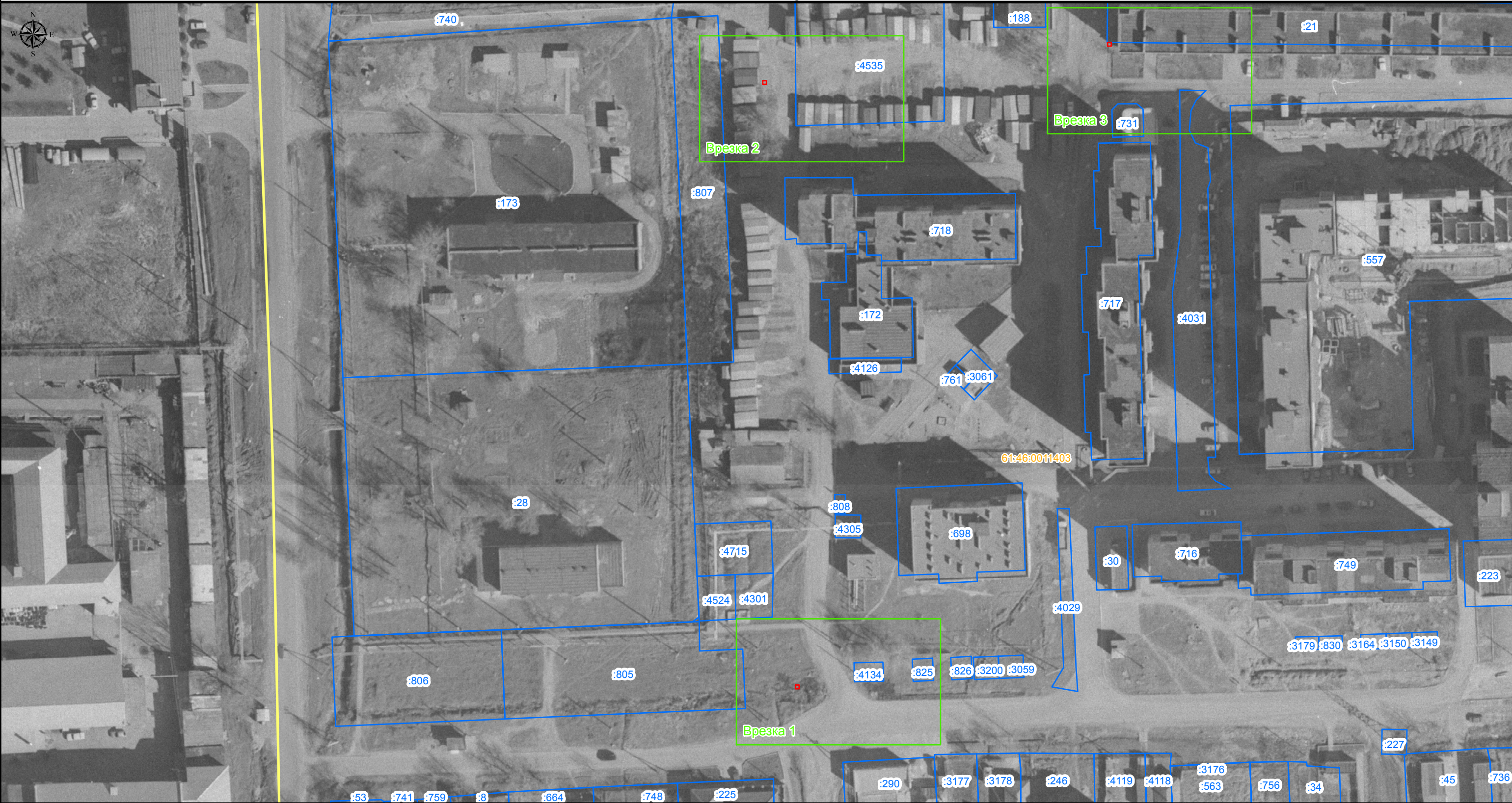
План границ объекта