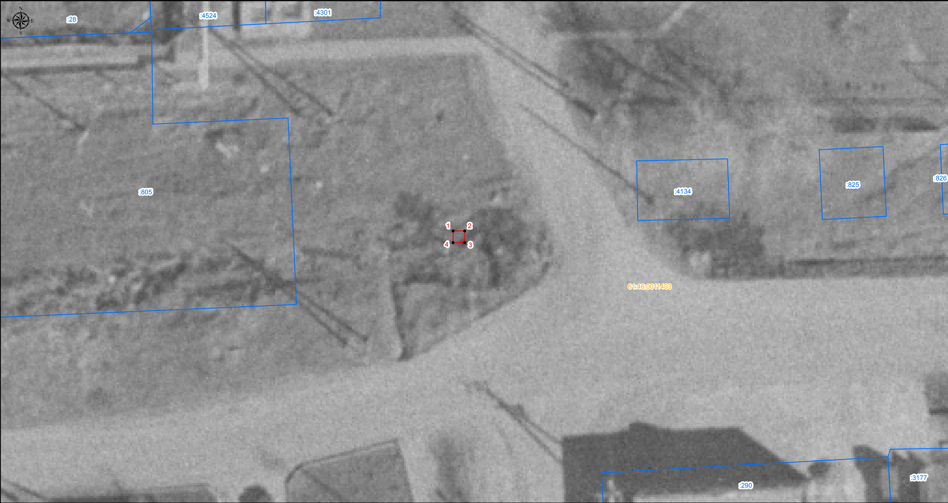
План границ объекта (врезка 1)