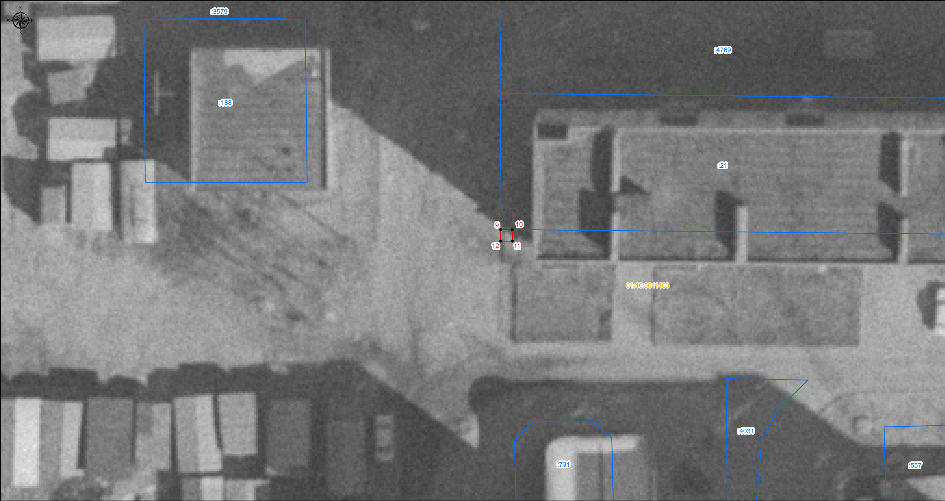
План границ объекта (врезка 3)