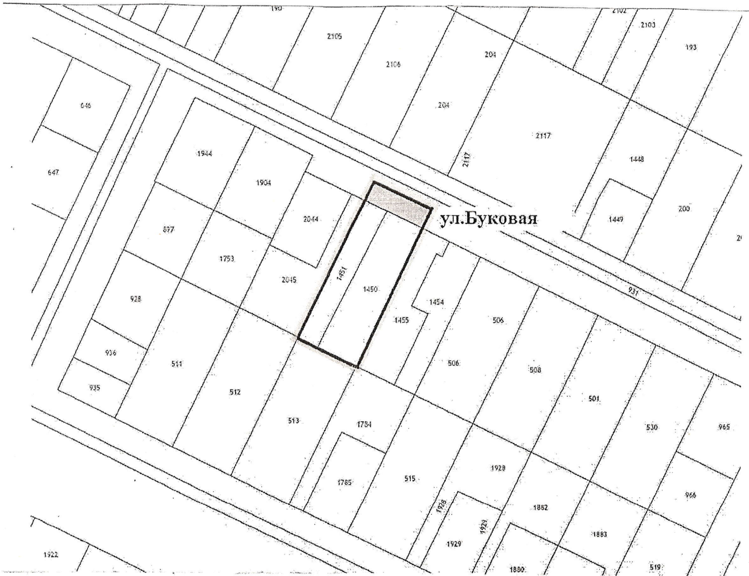
Схема границ территории выполнения внесения изменений в проект планировки и проект межевания, расположенной в кадастровом квартале 61:46:0012401 в районе ул. Буковой

Приложение к постановлению Администрации города Батайска от 18.11.2024 № 388