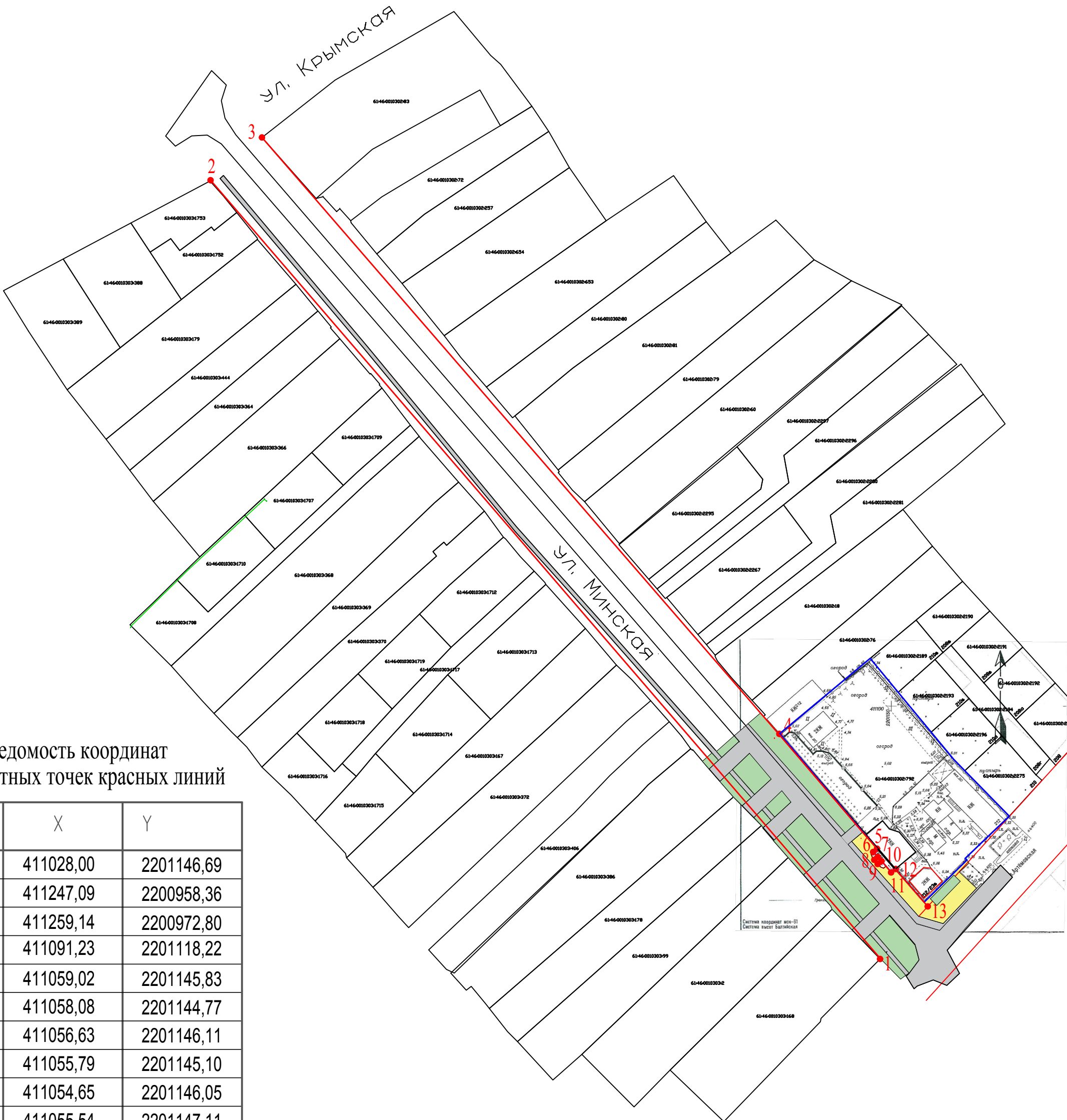
Ведомость координат поворотных точек красных линий