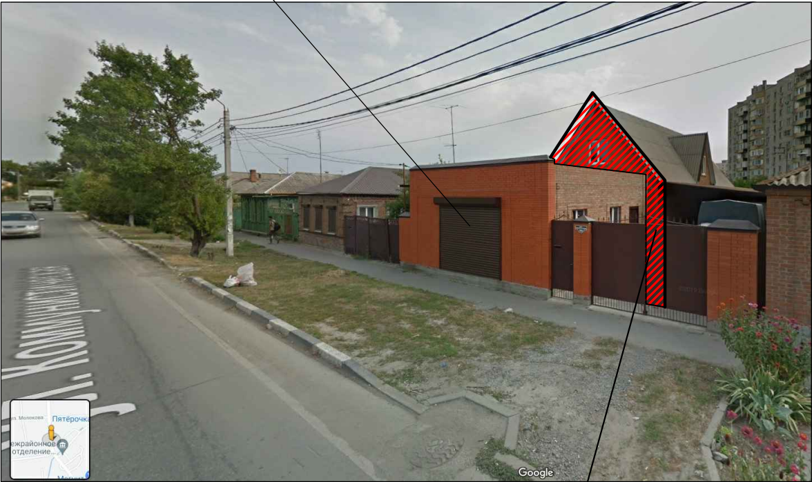
Противопожарная стена 1 типа, устройство