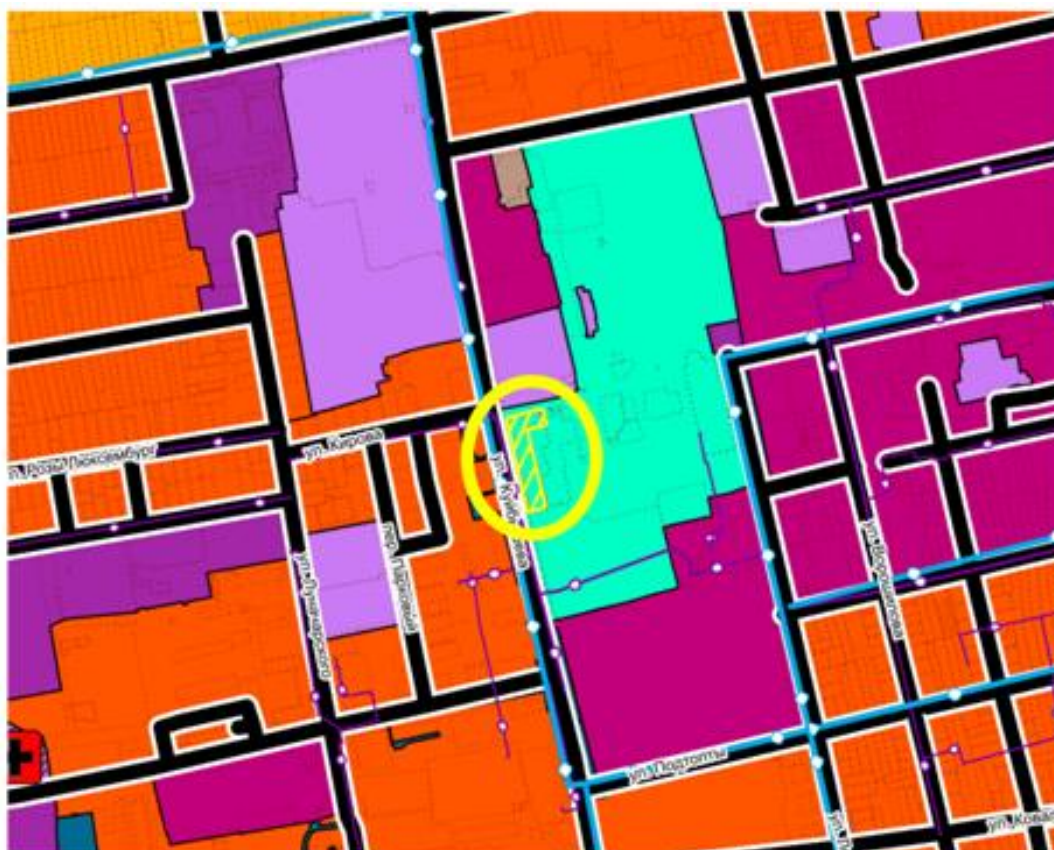
Земельный участок с кадастровым номером 61:44:0011701:239 на карте функциональных зон Генерального плана муниципального образования «Город Батайск» Ростовской области

В соответствии с действующим Генеральным планом городского округа «Город Батайск» Ростовской области, утвержденным решением Батайской городской Думы от 16.12.2020 № 90 Земельный участок отнесен к функциональной зоне озелененных территорий общего пользования.